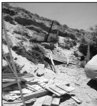
Figura 2. Defensas derrumbadas. P. Bonita