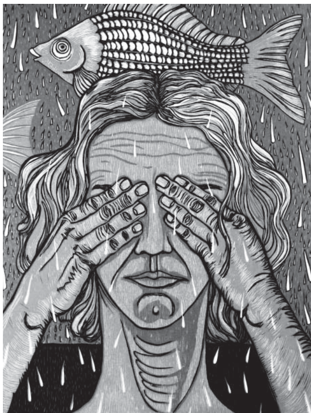
“Lluvia”, xilografía Dini Calderón

Gloria Borioli en Los rostros del lenguaje. Prácticas de lectura y escritura en la formación de profesores analiza el vínculo que los profesores y los futuros profesores tejen con la lectura y la escritura, para intentar desde allí potenciar las fortalezas y remediar las debilidades que el ejercicio de esas prácticas de lenguaje tienen en los ISFD y la universidad.