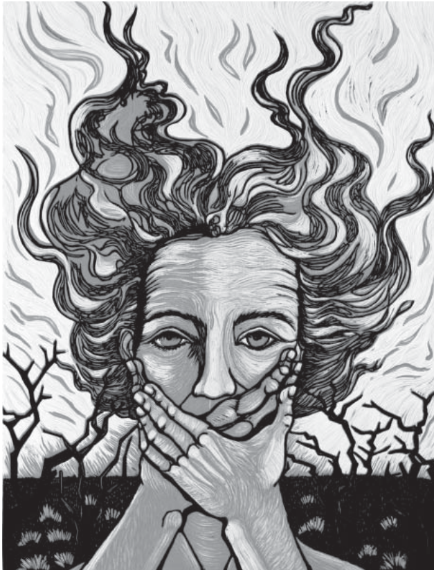
“Fuego”, xilografía Dini Calderón

te. Ellos ya nos han pagado para que aprendamos cosas. Nuestra tarea es devolverlo.