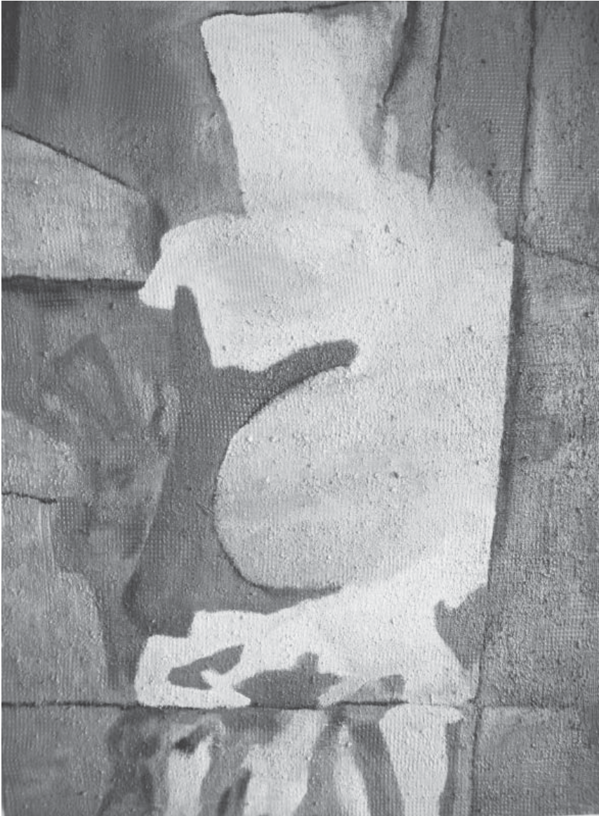
"Amanecer costero" , óleo Carlos Oriani