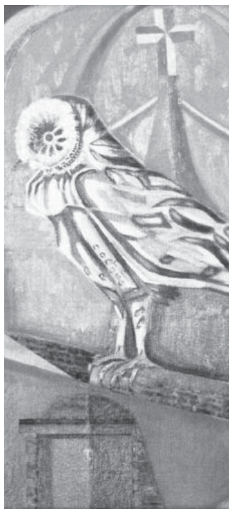
Detalle obra "Lechuza de campanario", Mario Sáez